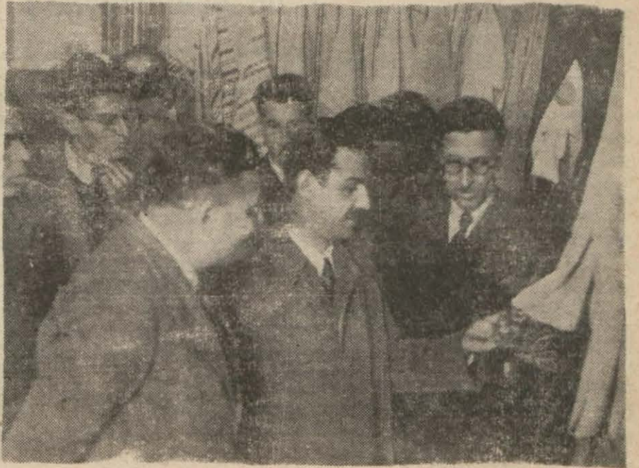
Parti reisi «Köy elişleri sergisi» ni gezerken

Eminönü Halkevinde ilk defa açılan «Köy elişleri sergisi» alâka ile karşılandı, bütün hususiyetlerle canlandırılan köy odası çok beğenildi